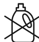
Lavage sans adoucissant